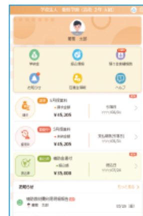
LC 学費サイトのホーム画面

※メールアドレスと利用者 ID は 「本登録完了のお知らせ」メールに 記載されています。